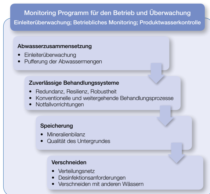
Abb. 2: Elemente eines Wasserrecycling-Systems (nach Drewes & Horstmeyer, 2016)

aber auch aktiv durch eine Abwassermengenbewirtschaftung gewährleistet werden, die zur einer Vergleichmäßigung der Rohwasserqualität beim Eintritt in die Behandlungsanlage beiträgt. Die Abwasserbehandlungsanlage selber muss so ausgelegt sein, dass gerade bei hohen Wasserqualitätsanforderungen, ein robuster Betrieb auch bei wechselnden Betriebszuständen gewährleistet ist und gewisse Redundanzen vorgehalten werden. Zu berücksichtigen sind darüber hinaus potentielle Wasserqualitätsänderungen in der Verteilung oder bei der Mischung unterschiedlicher Wässer sowie die Einhaltung hygienischer Standards bis zum Endverbraucher. Ein derartiges Management setzt den Gedanken der „Qualitätssicherung“ für den Betrieb sowie eine eingehende Ausbildung und Schulung des Personals voraus (Capacity Building).