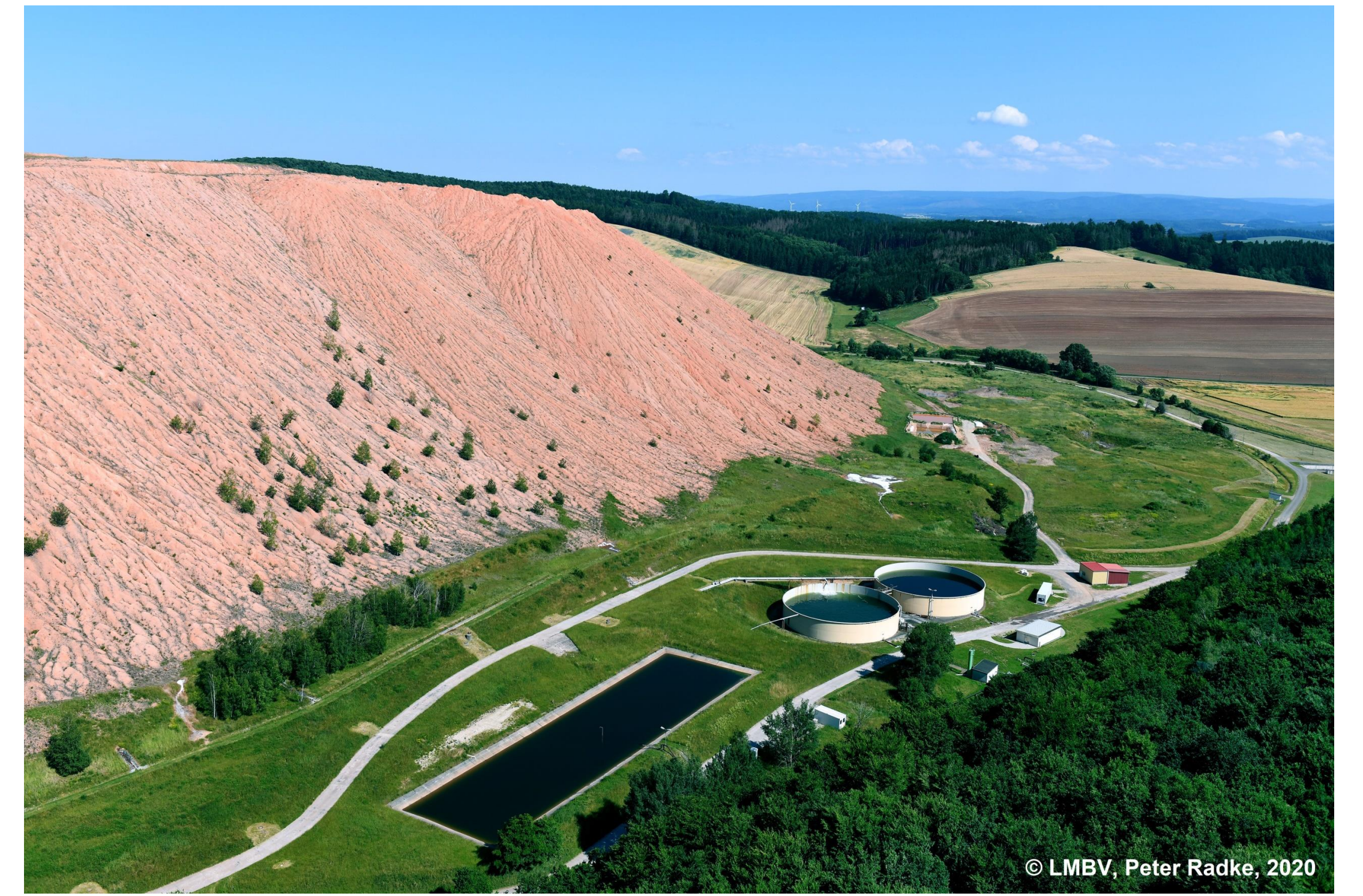
Rückstandshalde und Stapleinrichtungen Bischofferode, Foto: LMBV, Peter Radke 2020

Niederschläge auf Rückstandshalden der Kaliindustrie verursachen salzhaltige Haldensickerwässer. Eine Aufbereitung mittels der klassischen Eindampf- und Kristallisationsverfahren zur Trennung von Wasser und Salzen aus hochkonzentrierten Salzlösungen ist, im Gegensatz zur dauerhaften Abdeckung der Halden, mit einem sehr hohen Energieeinsatz und entsprechendem technischen Aufwand verbunden. Aus diesem Grund wird in diesem Projekt die Verschaltung von Membrandestillation und Kristallisation als Alternative zum klassischen Eindampfprozess untersucht.